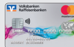
Farbenspiel (Designcode 41)