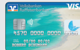
Sandstrand (Designcode 40)